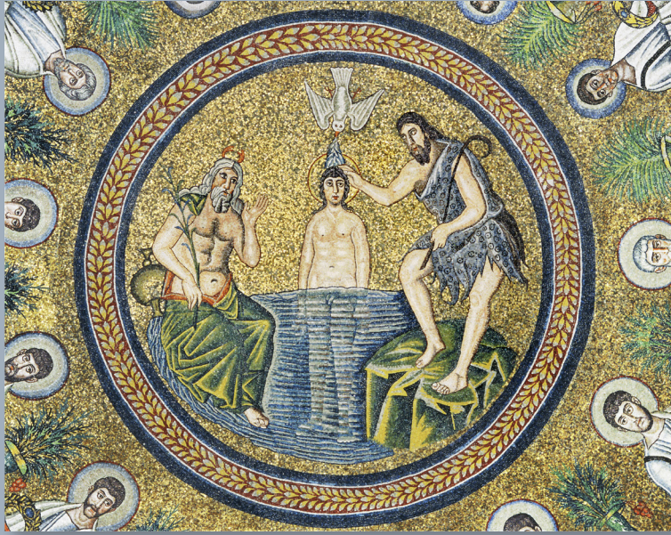
Taufe Jesu, Baptisterium Ravenna